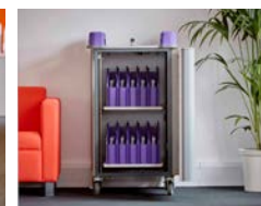
LapCabby Mini 20V